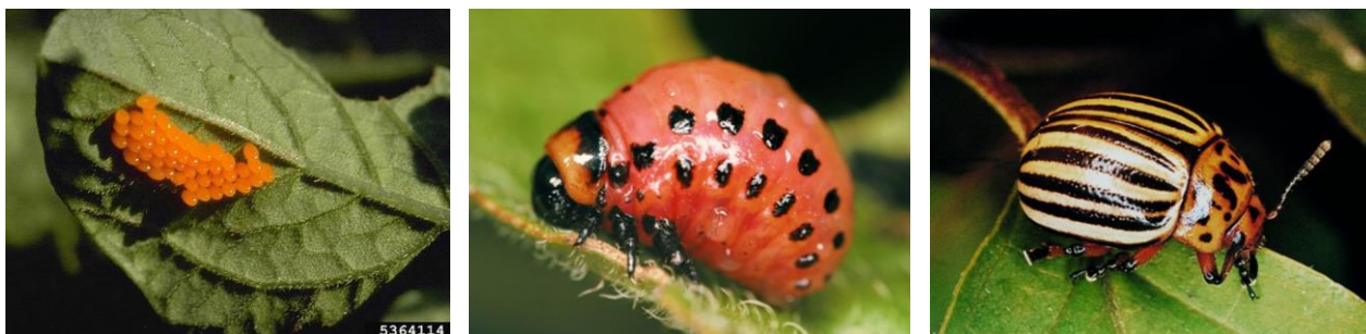
Œufs, larve et adulte de doryphore

L'adulte mesure environ 1 cm. Il est très reconnaissable grâce aux dix lignes noires sur son dos.