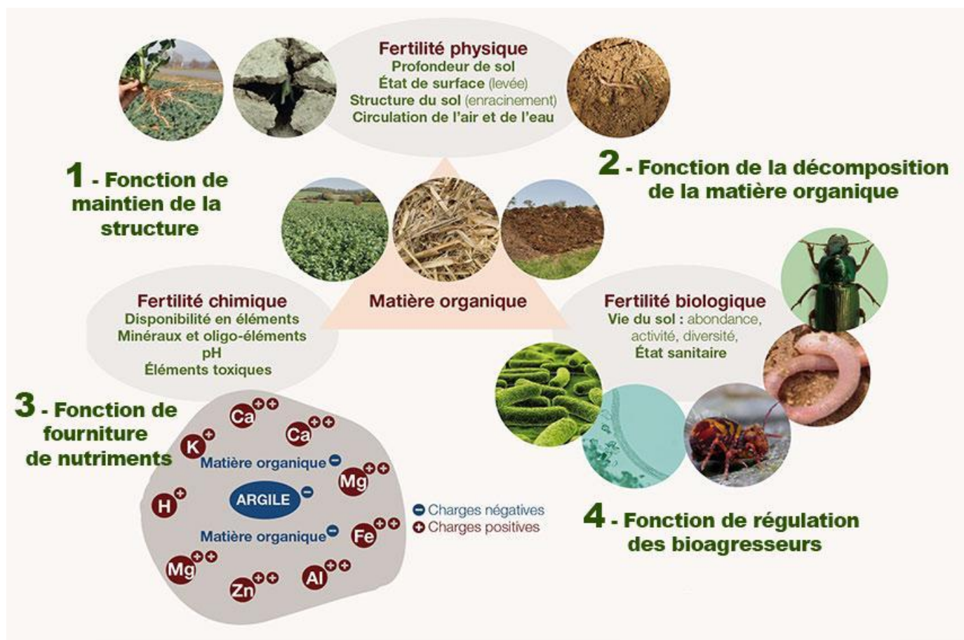
Figure 1 : Piliers de la fertilité du sol (Terres Inovia, 2023)

La matière organique est centrale dans la fertilité d'un sol , comme illustré dans le schéma ci-dessous :