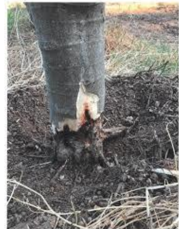
Dégâts du charançon sur figuier