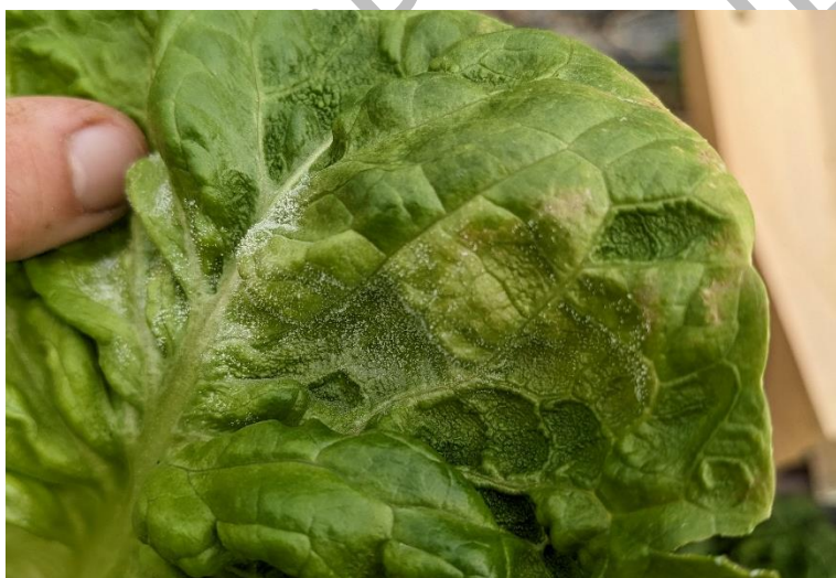
Mildiou (sur variété Gatsbi)