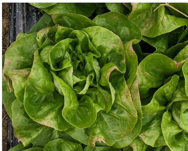
Nécroses après gel