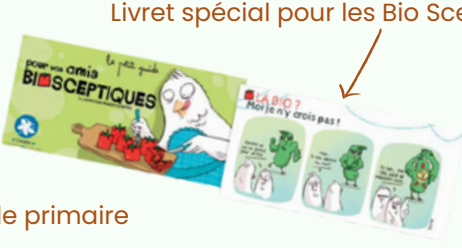
Livret spécial pour les Bio Sceptiques

De nombreux outils de communication gratuits sont disponibles au CivamBio66 N'hésitez pas à nous rendre visite