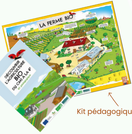
Kit pédagogique École primaire