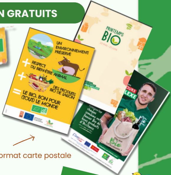
Affiches A4 et format carte postale