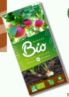
Carnet d'adresse Bio