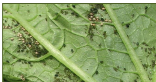
Colonies d' Aphis gossypii avec présence de momies d' Aphidius colemani

Les femelles d' Aphidius colemani qui éclosent des momies volent et prospectent la culture à la recherche des pucerons.